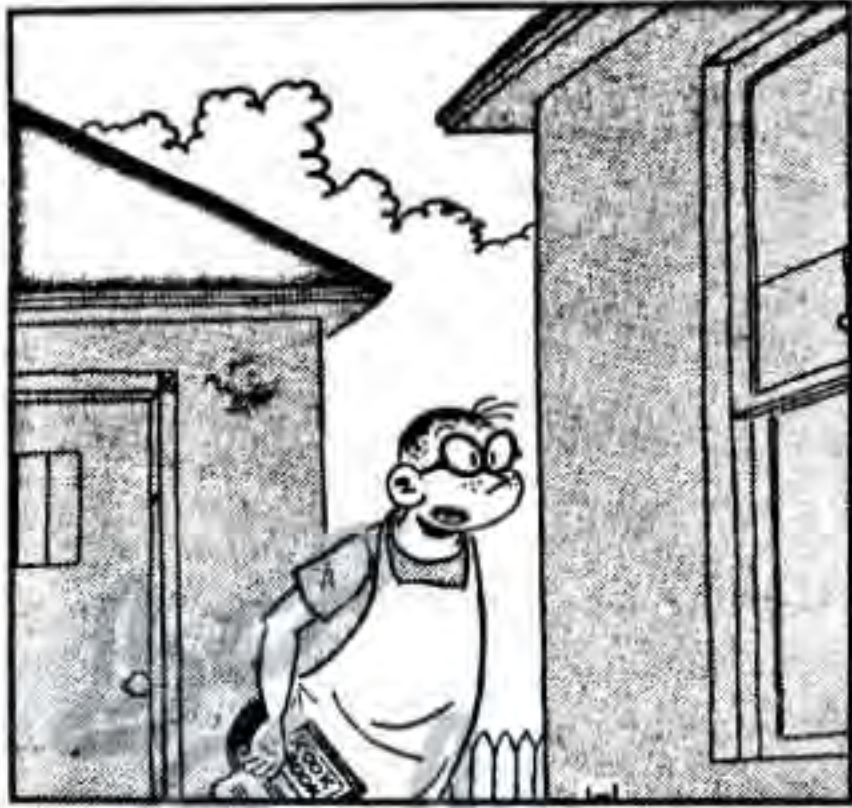
بی پڑوسن! کیا مجھے دس انڈے اور آدھا کلو گوشت ادھار مل سکتا ہے

فرانسکو جانا ہے۔ میں اس وقت یہاں سے تمہیں تفصیل نہیں بتا سکتی۔ بات طویل ہو جائے گی۔ مجھے افسوس ہے کہ اس روز میں مجبور تھی، تمہیں دوبارہ فون نہیں کر سکی۔ مجھے یقین ہے کہ تم معاف کر دو گے۔“